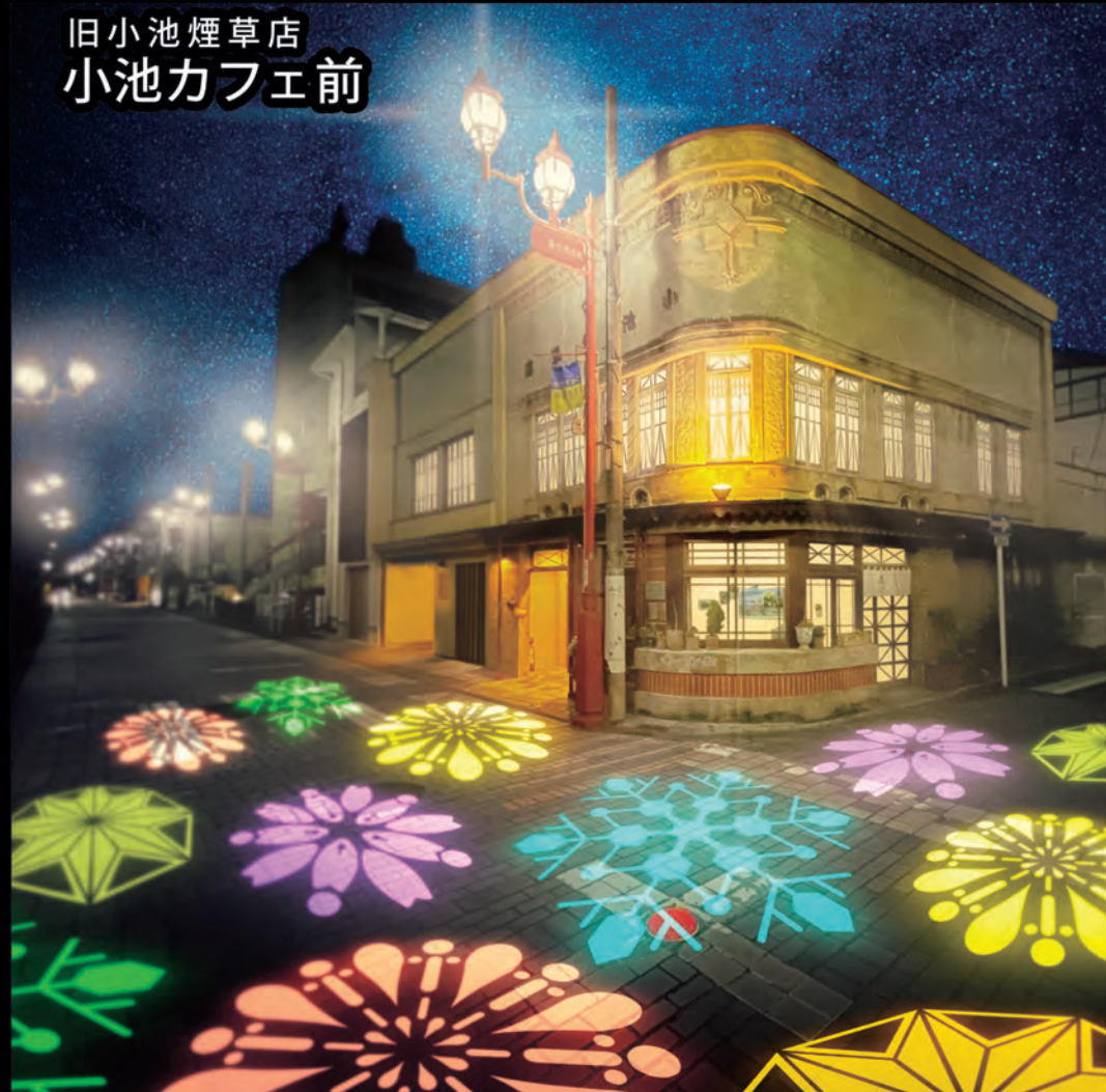
旧小池煙草店 小池カフェ前