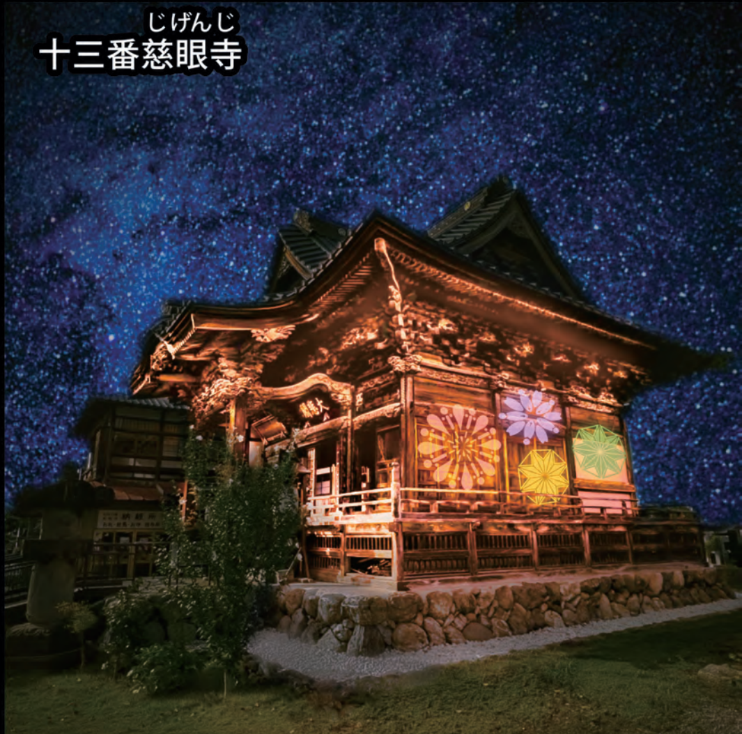
じげんじ 十三番慈眼寺