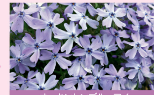
オーキントンブルーアイ