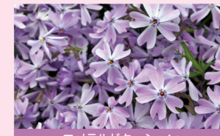
エメラルドクッション