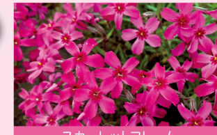
スカーレットフレーム