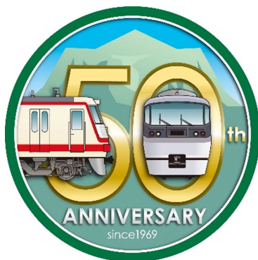
西武秩父線開通 50 周年記念ロゴ

これからも西武鉄道は、西武秩父線が皆さまから愛される路線であり続けることを目指し、様々な取り組みを進めてまいります。