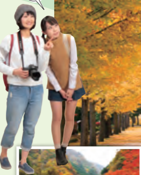
MAP C-5 秩父ミュージックパークイチョウ並木