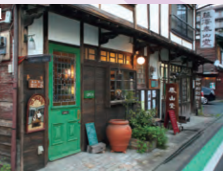
1. レトロなお店が立ち並ぶ雰囲気のある黒門通り。 2. 「秩父ふるさと館」土蔵を活かした地域の物産展示販売や郷土料理が楽しめる。 3. 写真スポットがいっぱい(小池煙草店)

秩父銘仙はかつて、この地方の産業の根幹を支えていました。こうした秩父銘仙、織物などに関する貴重な資料を収集、展示しているのが同館。「糸操室」「織場」など繭から織物になるまでの過程を紹介。型染めや手織り、藍染体験教室も開催しています。