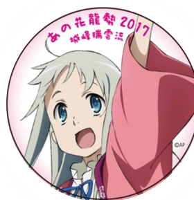
「あの花」オリジナル缶バッチ