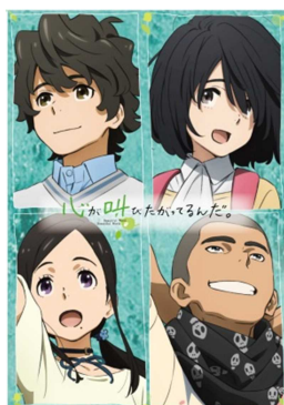
ここさけオリジナルクリアファイル（サイズA5）