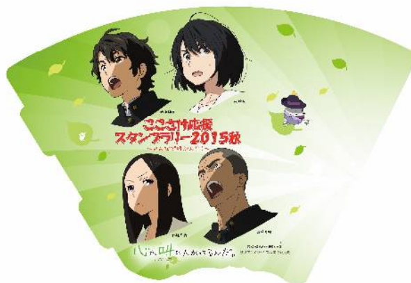
「ここさけ」応援オリジナルメガホン