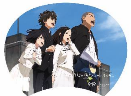
「ここさけ」応援オリジナルうちわ