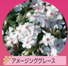
アメーシンググレース