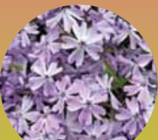
エメラルドクッション