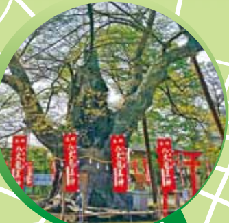
今宮神社の龍神木