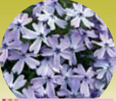
オーキントンブルーアイ