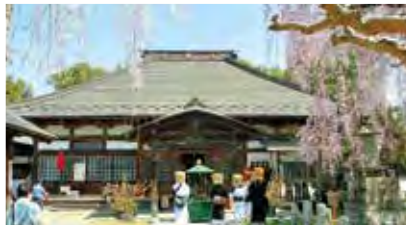
① 札所16番西光寺 本堂右手の回廊堂には四国88ヶ所霊場の本尊を模した仏像が並び、参拝すれば四国巡礼と同じ功德を得られるとされています。#札堂 #酒樽大黒天