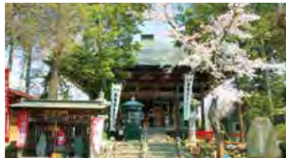
② 札所17番定林寺 アニメ「あの花」の聖地として知られています。県指定の有形文化財である梵鐘は参拝前につくと利益があるとされています。#あの花絵馬 #秩父三名鐘