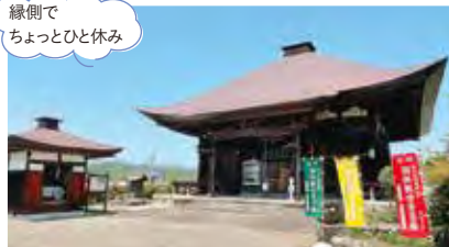
④ 札所19番龍石寺 本堂は丘陵上の露出した大きな岩盤の上に建てられています。そよ風が吹く、縁側からは荒川の対岸や秩父橋を見渡せます。#ジオパーク秩父 #厄除け観音