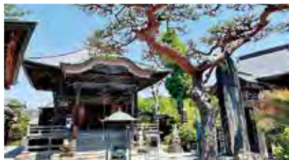
③ 札所18番神門寺 寺名は榎の大木がまるで神門のようにこと由来しています。境内に入ると微笑みを浮かべた地藏尊が温かく迎えてくれます。#ニコニコ地藏尊 #国道140号