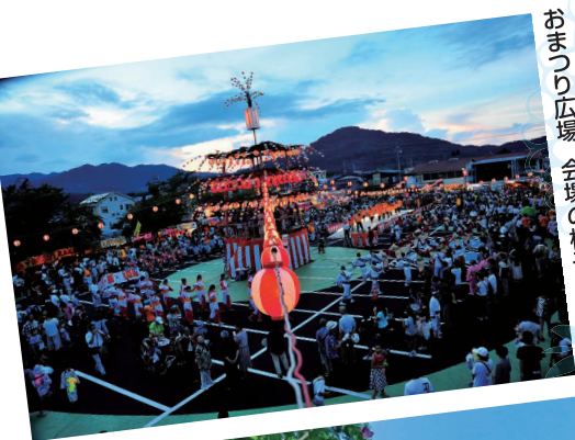
おまつり広場 会場の様子