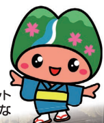
皆野町のマスコット み～な