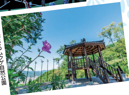
町を一望できるムクゲ自然公園