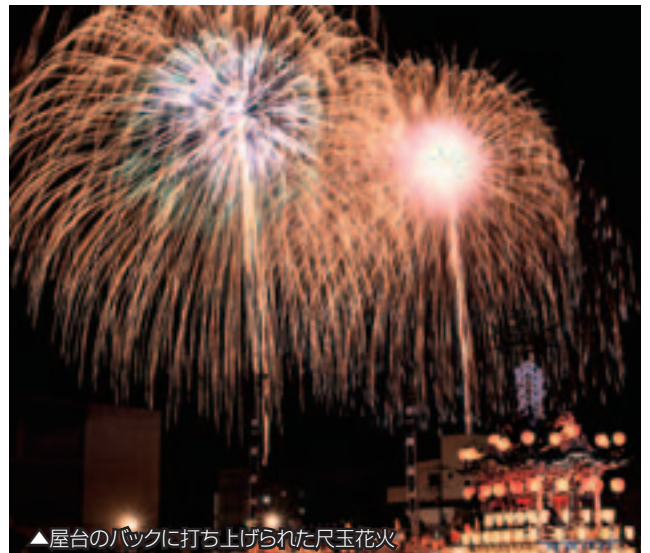
▲屋台のバックに打ち上げられた尺玉花火

羊山公園で打ち上げますので、市役所付近から西武秩父駅にかけての国道140号沿い、及び道の駅ちちぶから広くご覧いただけます。(中面地図をご覧ください)