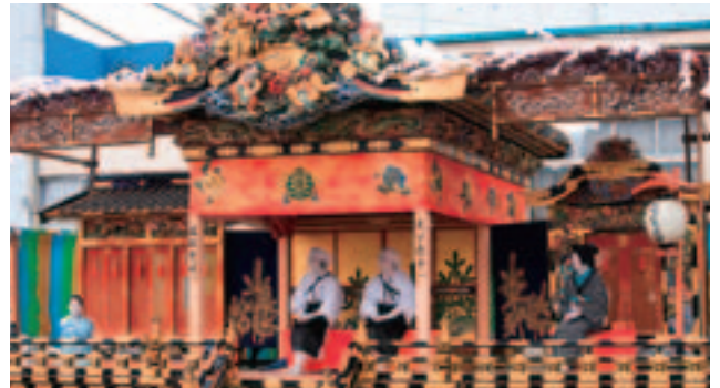
▲中町屋台で上演される屋台芝居

今年では中町屋台が、2日の18:00から20:30までと3日の11:00から14:00まで中町・ベスト矢尾前にて、屋台芝居(歌舞伎)を上演します。