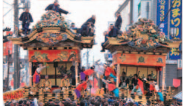
▲左:上町屋台と右:中町屋台